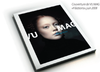
Couverture de VU MAG 1 «Filigranes» juin 2008